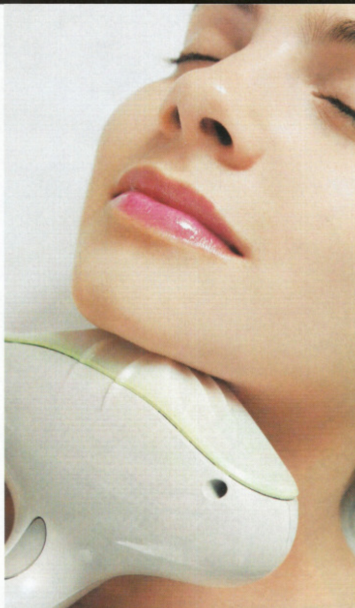
A LUCIR ESCOTES. La piel del cuello retoma un estado firme y muy terso, sin dejar cicatriz o marca alguna.

La molesta temblorina de la piel flácida al mover el brazo, el roce de las piernas al caminar y la evidente piel "colgada" del cuello –debido a la edad, al exceso de sol, a la falta de actividad física o a la mala alimentación– pueden desaparecer gracias al Skin Thightening.