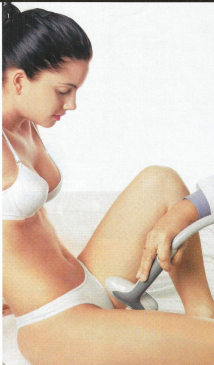
ADIÓS AL ROCE DE PIERNAS. La luz infrarroja se deja actuar sobre la dermis 30 minutos. Los resultados son inmediatos.